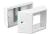
einfach single gang